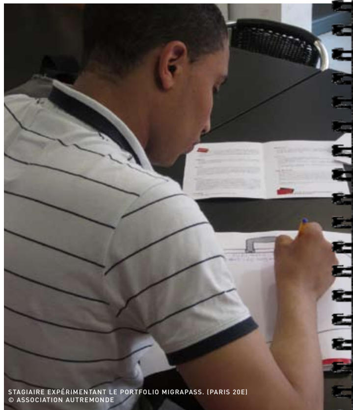
STAGIAIRE EXPÉRIMENTANT LE PORTFOLIO MIGRAPASS. (PARIS 20E)

Les résultats de ce projet seront présentés le 20 septembre, lors d'une conférence au pavillon Carré de Baudoin (20 ème arrondissement)