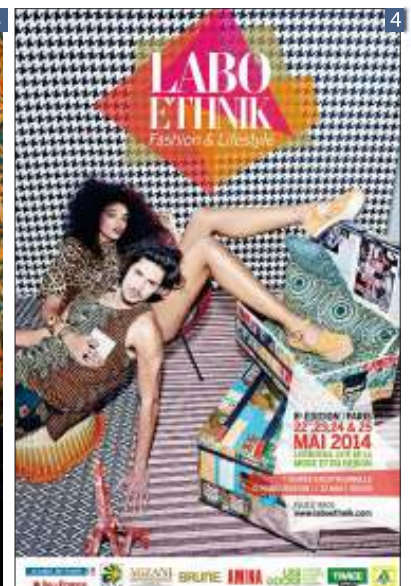
1 : © BABATUNDE 2 : COLLECTION 2014, LAURENCEAIRLINE © WILLEM JASPERT 3 : COLLECTION CHIC TRIBAL, JUNE SHOP © ALINE RABUSSEAU 4 : © LABO ETHNIK 2014

Pour en savoir plus : HTTP://LABOETHNIK.COM