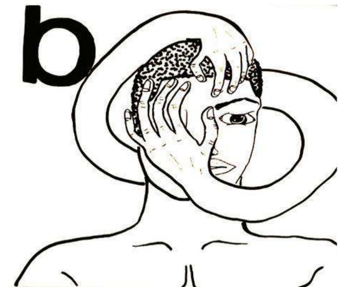
L'ABÉCÉDAIRE DE L'ESCLAVAGE RÉALISÉ PAR UNE CLASSE DE 4ÈME DU COLLÈGE EDOUARD VAILLANT (BORDEAUX) AVEC LA PLASTICIENNE FEDERICA MATTA

Pour dire l'histoire de l'esclavage, l'ITM a choisi la création : peinture, ateliers poétiques, pièces de théâtre. Les résultats de ces ateliers sont visibles sur un mémorial virtuel , sur internet. Il permet aux élèves de mieux comprendre l'esclavage. Le 25 mai 2014, l'ITM sera au Conseil régional avec 300 lycéens. Il va dévoiler cette face oubliée de l'Histoire, en poésie.