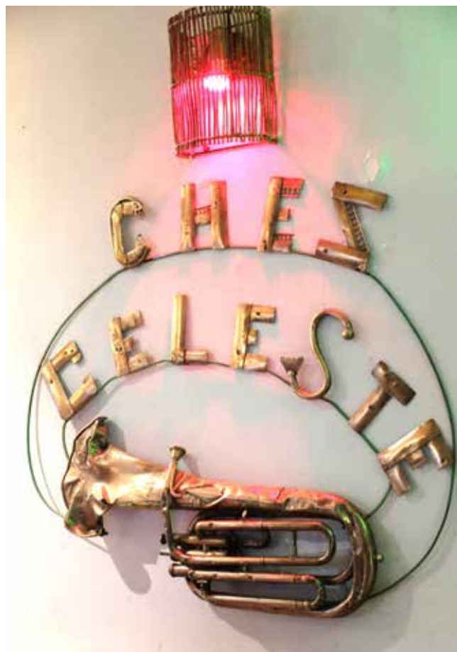
CHEZ CÉLESTE

C'est un mélange d'influences portugaises, caribéennes, mais aussi africaines, puisque le Sénégal est notre voisin.