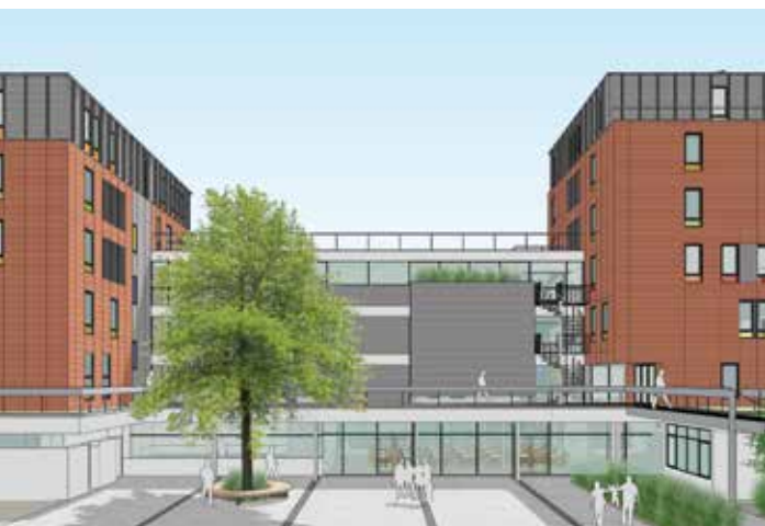
MAQUETTE DU NOUVEAU CENTENAIRE © ATELIER PHILIPPE JEAN

« Le Nouveau centenaire ». C'est le nom de l'habitat social et participatif qui ouvrira à la fin de l'année à Montreuil. L'objectif ? Proposer une alternative pour les foyers de travailleurs migrants.