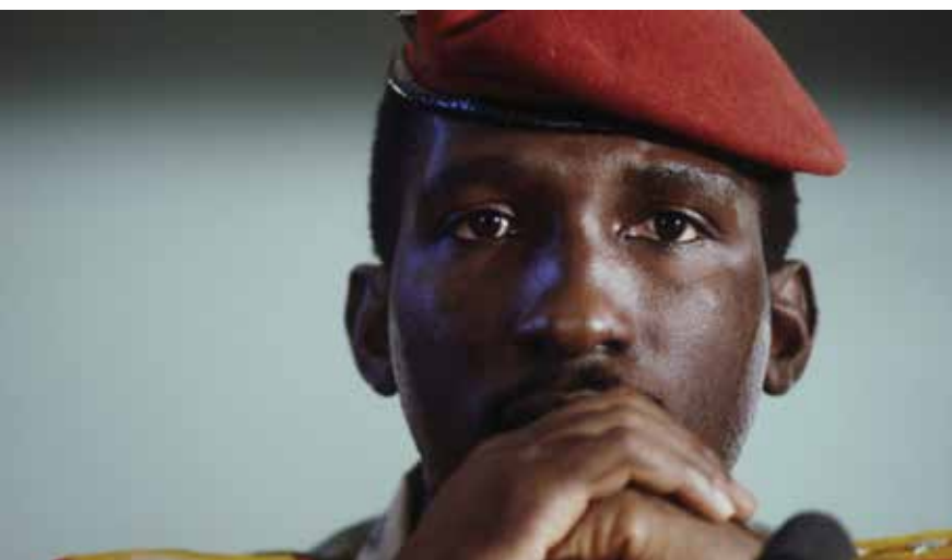
THOMAS SANKARA